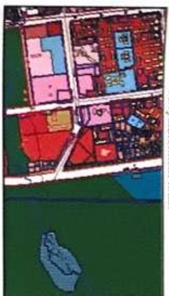
ЖЕЛТЫЙ ЦВЕТ - ОБЪЕКТ